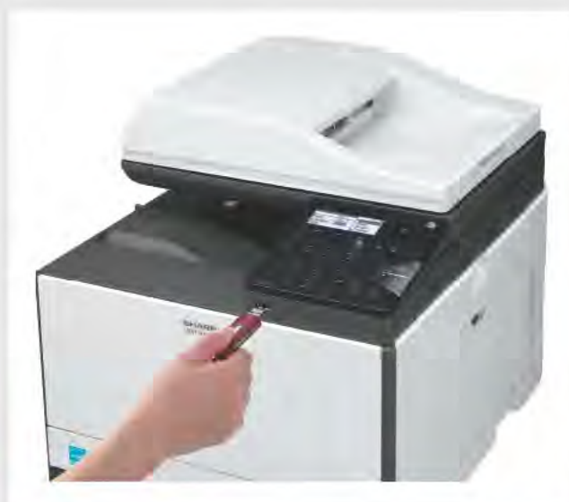
PORTA USB FRONTALE

Entrambi i modelli hanno in dotazione una comoda porta USB per stampare e scansire facilmente da una chiavetta. Inoltre, puoi connettere MX-C300W a una rete wireless e stampare direttamente dal tuo smartphone o tablet.