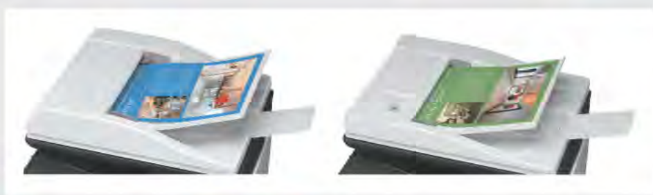
ALIMENTATORE DEGLI ORIGINALI