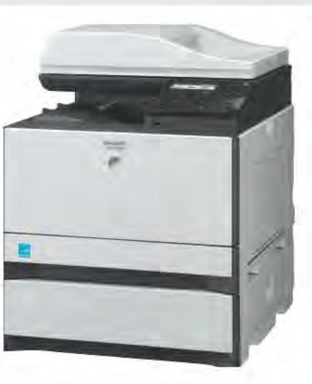
CASSETTO CARTA OPZIONALE DA 500 FOGLI